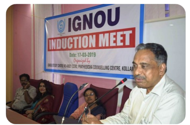
40021 - CCRD, Kollam