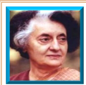
"Education is a liberating force, and in our age it is also a democratizing force, cutting across the barriers of caste and class, smoothing out inequalities imposed by birth and other circumstances." - Indira Gandhi