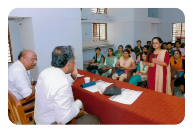
1464 - C. Achuthamenon Study Centre, Pujapura